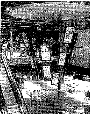
Un nouveau temple de la mode arrive au Luxembourg.

FOETZ - Le groupe belge de commerce de prêt-à-porter et de chaussures a ouvert son premier magasin au Grand-Duché de Luxembourg. Il est situé rue du Brill, sur la zone industrielle de Foetz, face à Cora. Créé en 1996, Rackstore possède deux points de vente en Belgique, l'un de 4 500 m 2 à Gosselies (près de Charleroi), l'autre de 3 500 m 2 à Jemappes (près de Mons). Celui de Foetz est un peu plus grand avec ses 5 200 m 2 . «Nos magasins sont exploités par nos soins, sans cellules com-